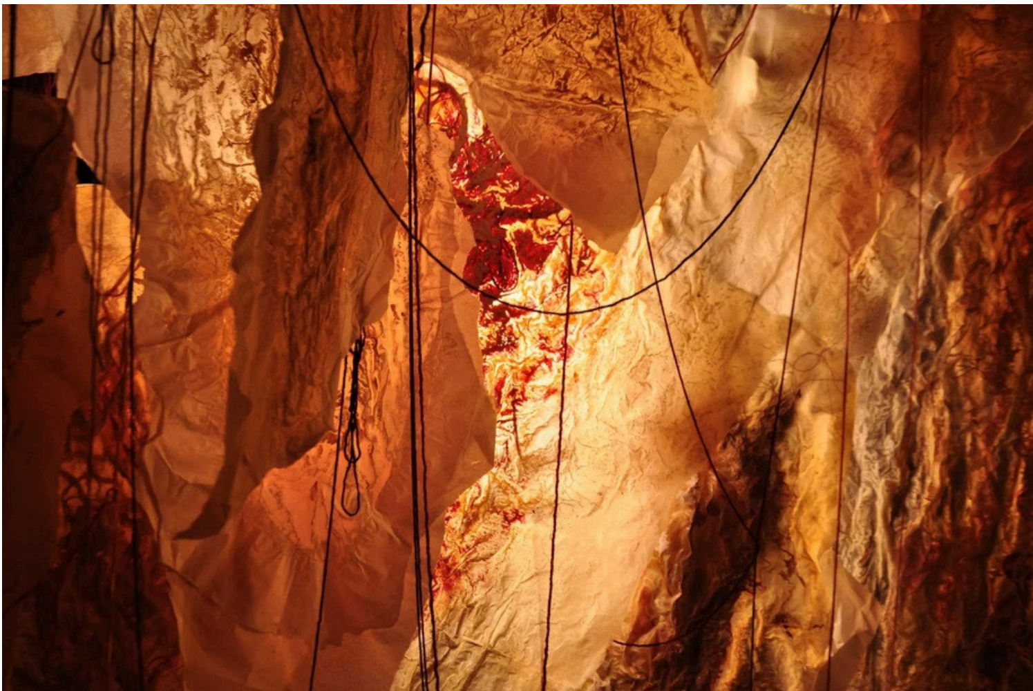
Cimetière Blanc, 2023